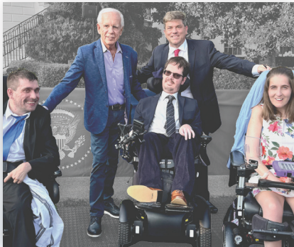
Miembros del Consejo del NCCDD

El Consejo representa a los habitantes de Carolina del Norte con discapacidades intelectuales y de desarrollo y es responsable de implementar las disposiciones de la Ley de Asistencia y Declaración de Derechos para Discapacidades de Desarrollo de 2000 (Ley DD). El 60 por ciento de los miembros del Consejo, que cumple un mandato de hasta dos años, son personas con discapacidades intelectuales y de desarrollo o miembros de su familia, y el resto son representantes de agencias estatales, organizaciones sin fines de lucro y profesionales. El Consejo guía todas las iniciativas y contratos.