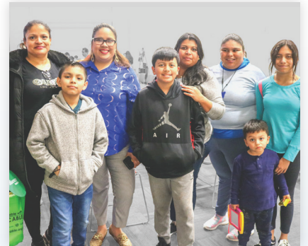
Socios de la red DD