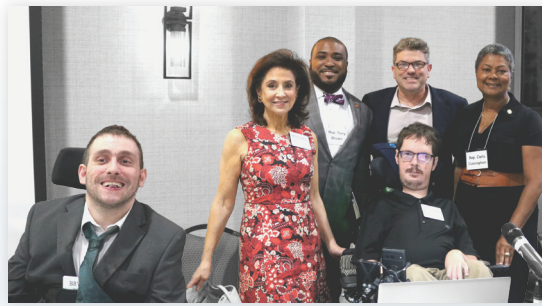
Personal del NCCDD