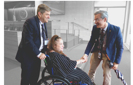
Talley Wells y Cheryl Powell se reúnen con el senador Lee (repblicano del distrito 8)